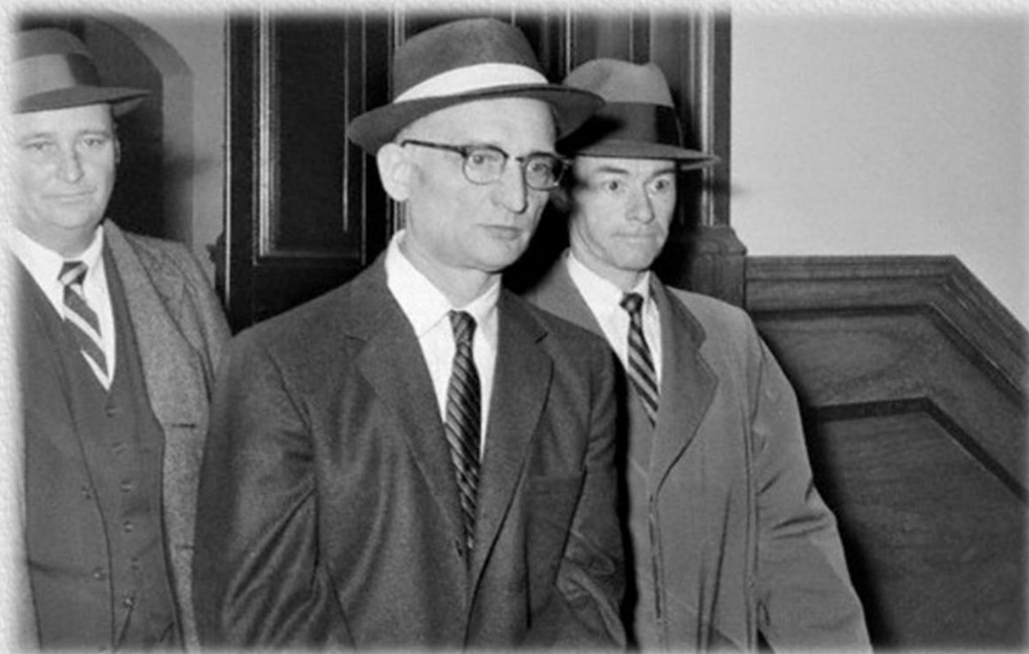
Гражданин СССР Рудольф Абель в американском суде. 1957 год

Под именем гражданина СССР Рудольфа Ивановича Абеля полковник Вильям Фишер был предан суду и приговорен к 32 годам каторжной тюрьмы. Из этого срока он отсидел пять лет.