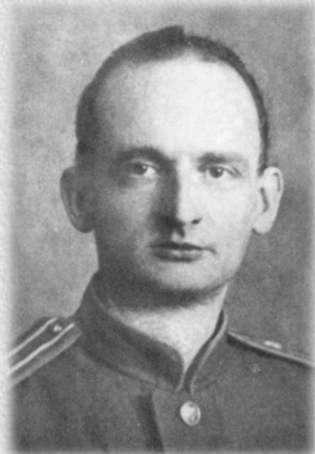
Вильям Генрихович Фишер

Дочь Вильяма Фишера уверена, что первая встреча людей, которые стали закадычными друзьями, состоялась в Москве в 1937 году, после возвращения ее отца из командировки в Великобританию. С тех пор, по воспоминаниям и родных, и коллег обоих разведчиков, их связывала очень тесная дружба: после возвращения из Самары в начале 1943 года оба жили в Москве на квартире Фишеров, часто появлялись на службе вместе, и их даже нередко путали, называя именами друг друга.