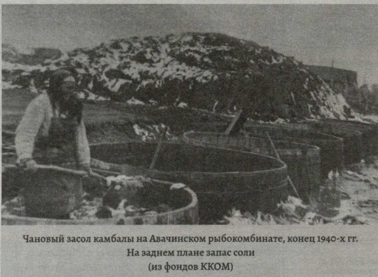
Чановый засол камбалы на Авачинском рыбокомбинате, конец 1940-х гг. На заднем плане запас соли (из фондов ККОМ)

- То есть в последнее время ваша тематика – это не только рыбаки и моряки Камчатки?